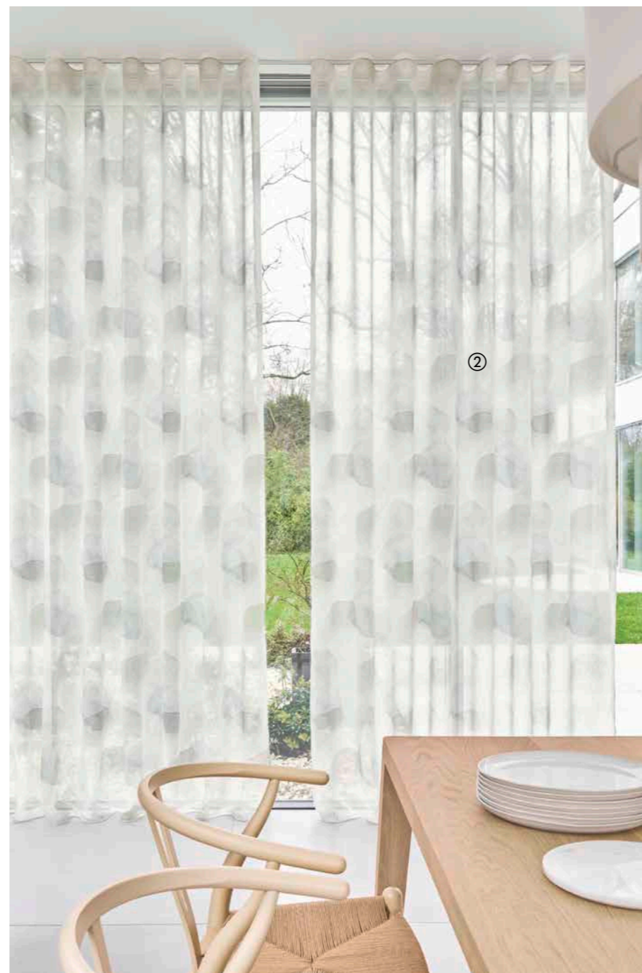
① CROSSING JA8070-090 ② WATERCOLOR JA8075-051

CROSSING , avec un pourcentage élevé de coton et de viscose, présente une interprétation décontractée d'un motif à carreaux. Le décor a été surimprimé en couleurs. Les deux niveaux du dessin ont l'effet pittoresque d'une aquarelle – disponible en 6 couleurs.